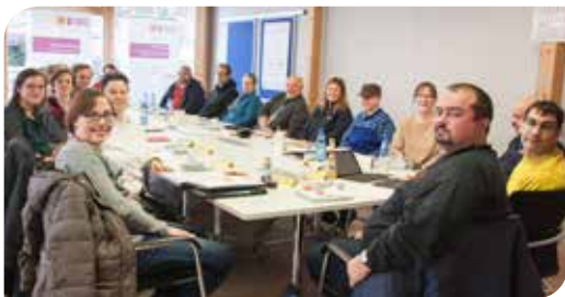
Neue Werkstatträte (Seite 6 und 7)