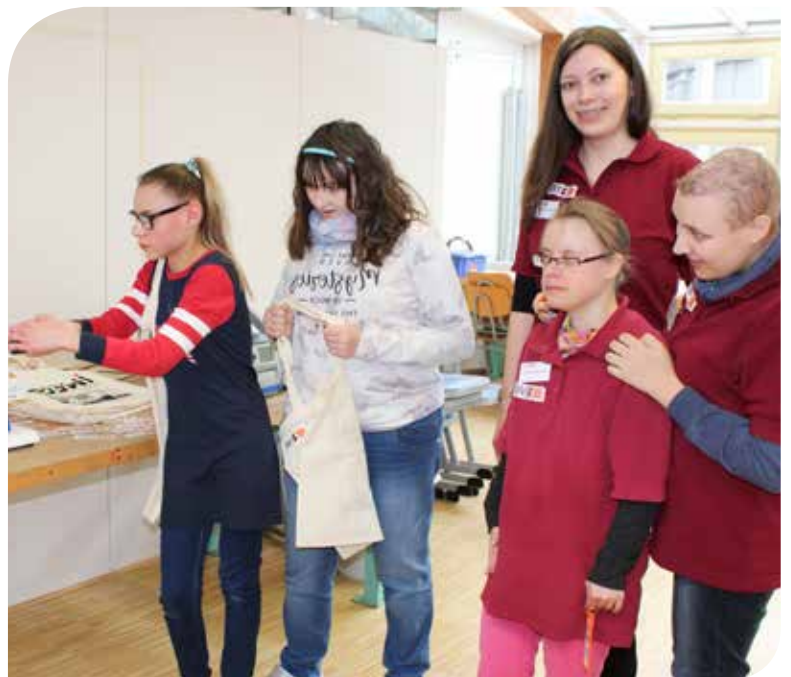
Begeisterte Besucher an der Patchmaschine

Am 23. Februar durfte die IWL Machtlfing ihr Arbeitsangebot beim Tag der offenen Tür in der Franziskussschule in Starnberg vorstellen. Damit die ganze Angelegenheit abwechslungsreich wird, wurde die Patchmaschine mitsamt Etikettendrucker eingesetzt. Die Besucher konnten sich einen IWL-Schlüsselanhänger oder auch eine iWELO-Tasche mit eigenem Namen patchen. Dieses Angebot wurde von Schüler/innen, Lehrer/innen, Angehörigen und Kooperationspartnern mit Freude genutzt. Hierbei entstanden viele interessante Gespräche und die Besucher konnten sich dabei über das weitere Angebot und über die Wege in die IWL informieren. Nach diesem Erfolg ist der nächste Tag der offenen Tür schon eingeplant.