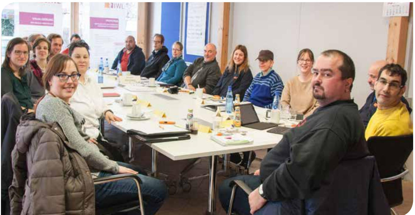
Werkstattratsmitglieder und Vertrauenspersonen beim ersten gemeinsamen Treffen in Landsberg, RDS

Welche Aufgaben erfüllen Werkstatträte? Der IWL-Werkstatttrat ist die gewählte Vertretung der Mitarbeiterinnen und Mitarbeiter mit Behinderung in den IWL-Betrieben. Er vertritt die Interessen der Beschäftigten gegenüber den jeweiligen Betriebsleitungen beziehungsweise der Geschäftsführung.