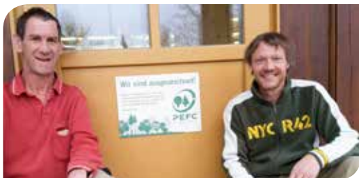
PEFC-Zertifizierung (Seite 10)