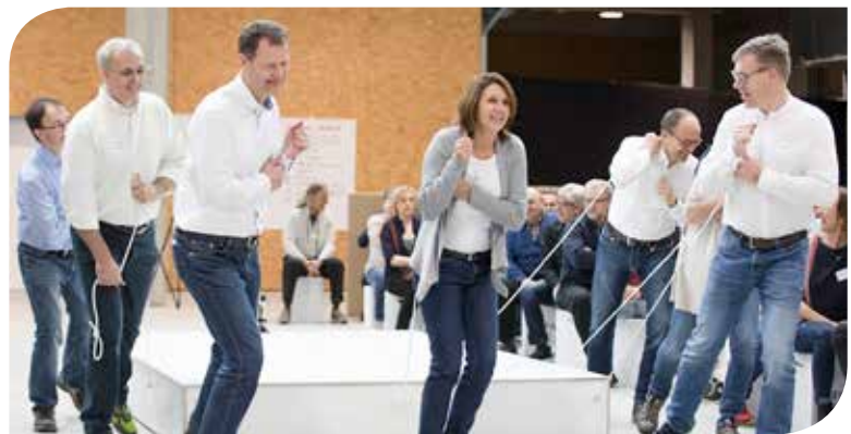
Teamwork als Fundament