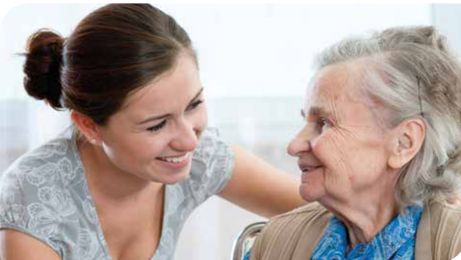
Für ein selbstbestimmtes Leben zu Hause - Freunde helfen

Was wir alles anbieten: Betreuung von demenzerkrankten Menschen, Unterstützung von pflegenden Angehörigen, Einkaufen, Unterhaltsreinigung, Wäsche waschen, bügeln, Blumenpflege, Tierversorgung, Hilfe beim Schriftverkehr, Wegebegleitung z.B. zum Friedhof, zu Veranstaltungen oder zu Konzerten, Computerkurse, Fahrdienste, mobiler Frieurservice und vieles mehr.