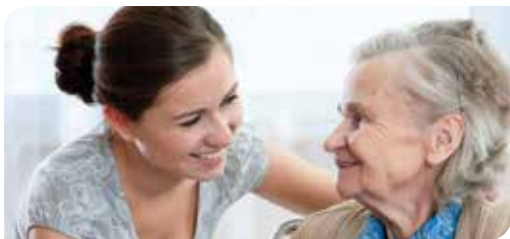
Freunde helfen (Seite 20 und 21)