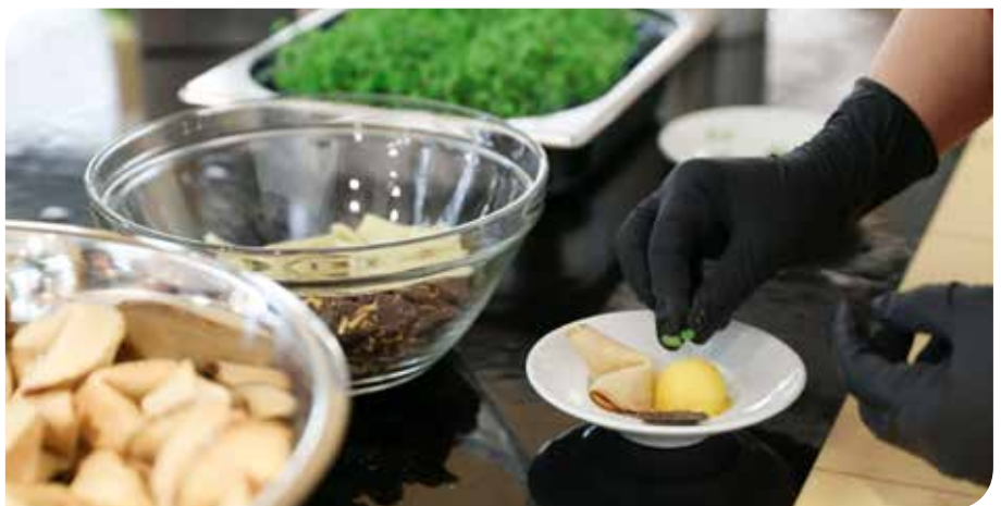
„Vision Food - Mango Sorbet mit schokolierten Insekten und IWL-Glückskeks“

mittelte das Gefühl „Vertrauen“, das erzielt werden sollte. Die klar-transparente Ochsenchwanz- bzw. Gemüse-Consommé, zum Wert „Transparenz und Klarheit“ passend, servierten die Servicekräfte zum ersten Mal im hauseigenen iwentcasino-Bauchladen. Auch die Drillinge aus dem Rohr mit Crème fraiche und edlem Kaviar bzw. Rote Bete-Tartar wurden passend zum Wert „Wertschätzung“, wertgeschätzt. Wer selbst Hand anlegen wollte, konnte sich am Gourmet Taco-Stand seine eigene Kreation zusammenstellen. Der IWL-Wertetag war somit nicht nur voller Emotionen, sondern auch eine kulinarische Reise für den Gaumen.