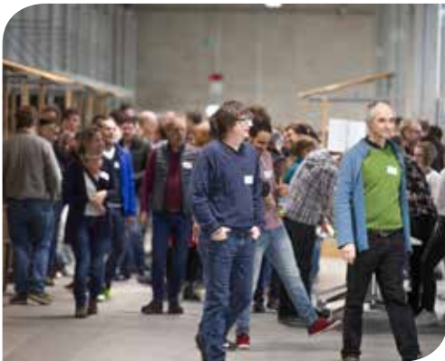
Ankommen der gespannter MitarbeiterInnen